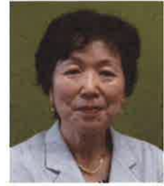
(公社)神奈川県栄養士会 会長