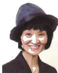
料理研究家 管理栄養士