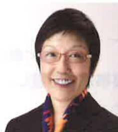
NPO法人 うま味インフォメーションセンター理事 農学博士