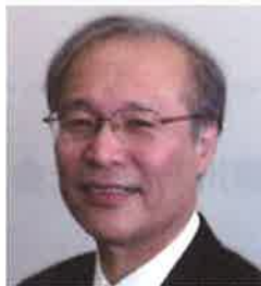
神奈川県立保健福祉大学学長 (公社)日本栄養士会名誉会長